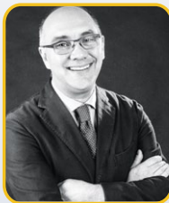
Odontoiatra Libero Professionista, Genova