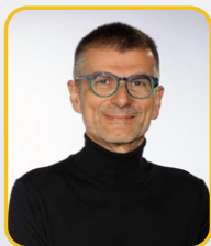
Odontoiatra, Libero Professionista, Asti Giornalista pubblicitaria Odontoiatria 33